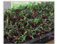
Roter Beete Sprossen